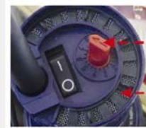
—無段式溫度轉鈕 —遮風過濾網